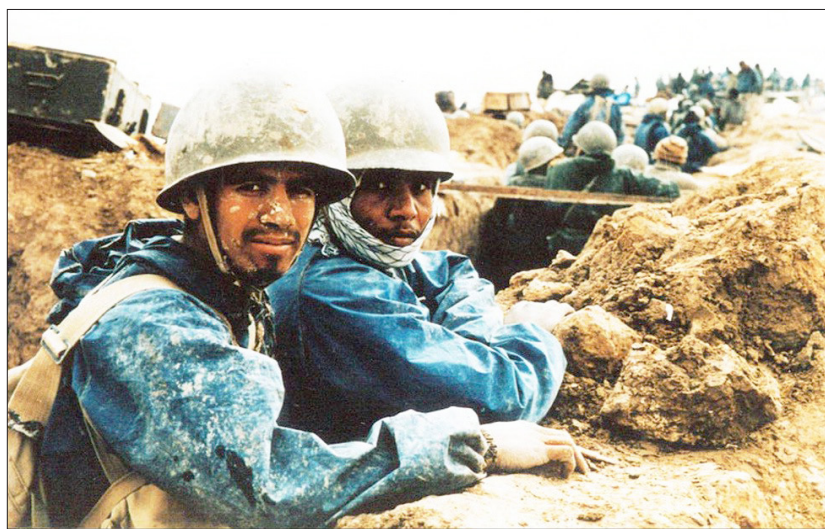
رزمندگان اسلام در خطوط مقدم عملیات کربلای ۵

حدود یک میلیون و ۲۰۰ هزار گلوله انواع خمپاره را به‌سوی مواضع ارتش عراق پرتاب کرد.