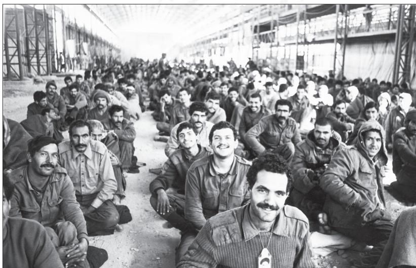
اسرای عراقی در عملیات کربلای ۵

نیروهای ما توانستند جلوی هجوم و پیشروی دشمن را گرفته و دایره منطقه عملیاتی را در محدوده‌ای به طول ۱۰ کیلومتر به سمت شلمچه و ۷ کیلومتر به سمت دریاچه ماهی با اعماق متفاوت محدود کنند. با وجود محدودیت منطقه عملیاتی، عملیات گسترده‌ای بود و ما وقتی بیشتر شگفت‌زده شدیم که نمی‌دانستیم دشمن با ایجاد رخنه در منطقه‌ای کوچک چه قصد و هدفی را دنبال می‌کند و تنها به چند خمپاره‌انداز و آتشبار سبک بسنده نکرده است. من تعداد دهانه‌های آتش در آن منطقه را برای هر دو طرف اعم از خمپاره‌انداز و تانک و دیگر